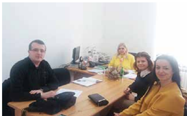
U posjeti Mješovitoj srednjoj školi „Travnik“

Poziv za članstvo u Klub matematičara otvoren je svim studentima Univerziteta u Travniku koji vole matematiku i žele biti dio tima koji će imati sasvim novi pristup matematici i prikazati je u mnogo ljepšem svjetlu.